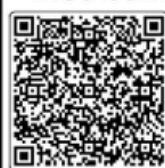
โครงการที่ 1