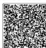
โครงการที่ 2

2. กรอกข้อมูลแบบฟอร์ม 3. ส่งแบบฟอร์มผ่านไลน์ ฝ่ายสินเชื่อสหกรณ์ฯ